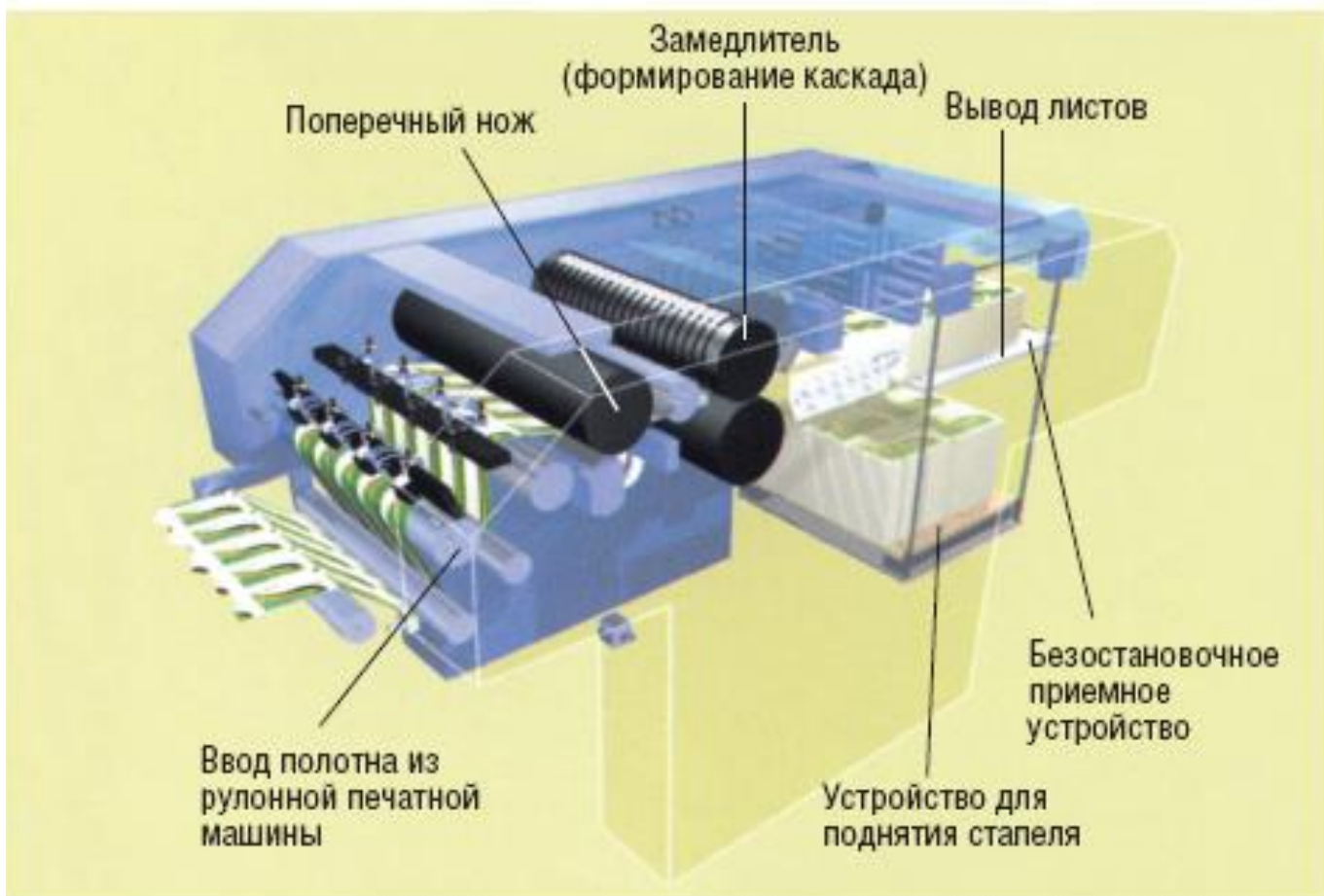
Схема устройства листового выклада VITS ROTOCUT.